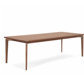
MUNICH TABLE 2011