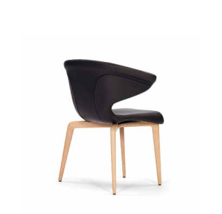
MUNICH ARMCHAIR 2009