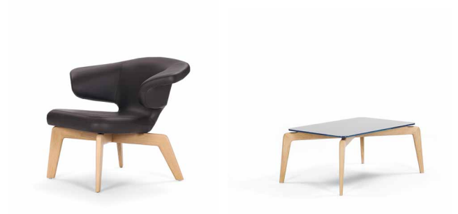
MUNICH LOUNGE CHAIR 2009