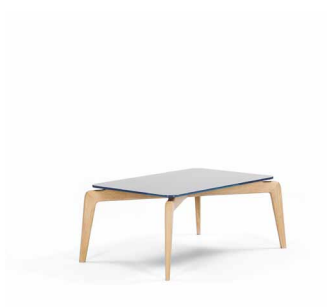
MUNICH COFFEE TABLE 2010