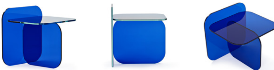
Royalblau royal blue