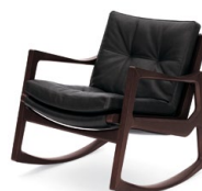
EUVIRA ROCKING CHAIR