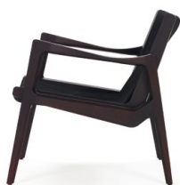
Eiche braun gebeizt, Kordel schwarz Oak brown-stained, cord black