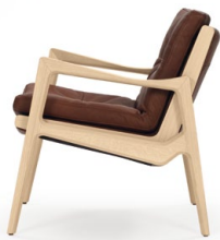
Eiche natur, Leder coconut Oak, leather coconut