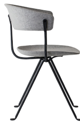
Frame: Black Seat and Back: Light Grey Divina Mélange (120)