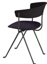
Frame: Black Seat and Back: Black Leather L-0060