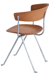
Frame: Galvanized Seat and Back: Natural Leather L-0090