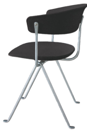
Frame: Galvanized Seat and Back: Dark Grey Divina MD (193)