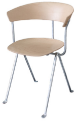
Frame: Galvanized Seat and Back: Natural Beech