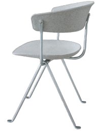
Frame: Galvanized Seat and Back: Light Grey Divina Mélange (120)