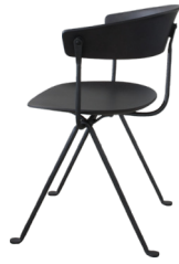
Frame: Black Seat and Back: Black Beech