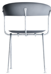
Frame: Galvanized Seat and Back: Metallised Grey 1761 C