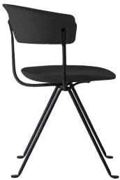
Frame: Black Seat and Back: Dark Grey Divina MD (193)