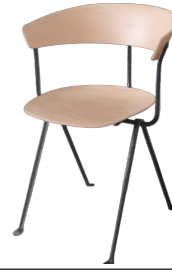
Frame: Black Seat and Back: Natural Beech