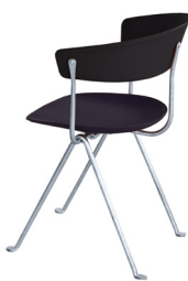
Frame: Galvanized Seat and Back: Black Leather L-0060