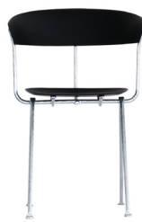
Frame: Galvanized Seat and Back: Black 1763 C