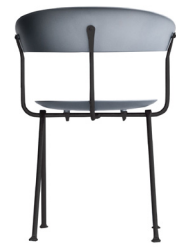
Frame: Black Seat and Back: Metallised Grey 1761 C