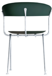
Frame: Galvanized Seat and Back: Dark Green 1555 C