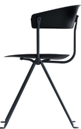
Frame: Black Seat and Back: Black 1763 C