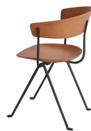
Frame: Black Seat and Back: Natural Leather L-0090