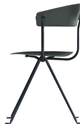
Frame: Black Seat and Back: Dark Green 1555 C