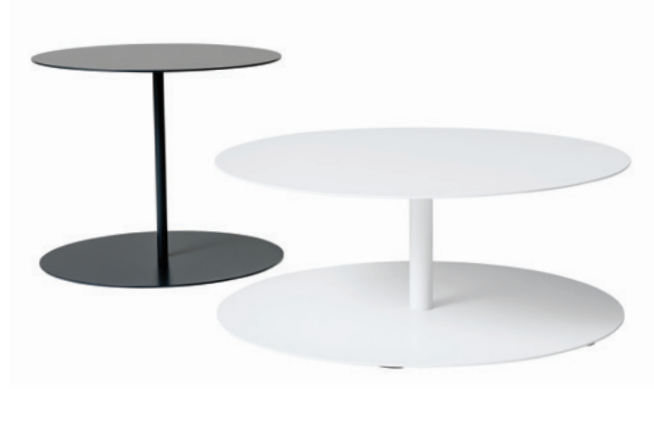
tavolini / service tables

GG_1 service table GG_2 low service table